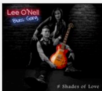
Shades of love. (LBG)